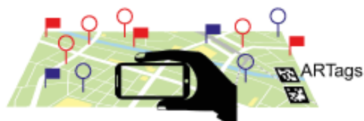
Figure 2. IHM smartphone au-dessus d'une carte

Le deuxième type d'IHM a pour but de faciliter le suivi des apprenants. L'objectif est de fournir des interactions et des indicateurs en RA, affichés sur la carte des lieux où se déroule la sortie, afin d'aider l'enseignant à contrôler la position physique des élèves, leur progression dans le jeu, mais également de les contacter ou de changer le scénario si les groupes sont en difficulté (figure 2). Ici, ce n'est pas la technologie de RA qui est innovante, mais le contexte dans lequel il est utilisé.