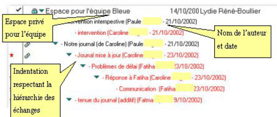
Figure 2 : Travail collaboratif par le forum asynchrone

Le suivi du forum permet de voir si tout le groupe participe régulièrement. Les outils offerts nous convenaient puisqu'il était bien question de prendre en charge nos étudiants, de les suivre, de les contrôler et de les aider au moment où la motivation pouvait baisser. Il était donc essentiel de pouvoir suivre le travail de chacun [4] .