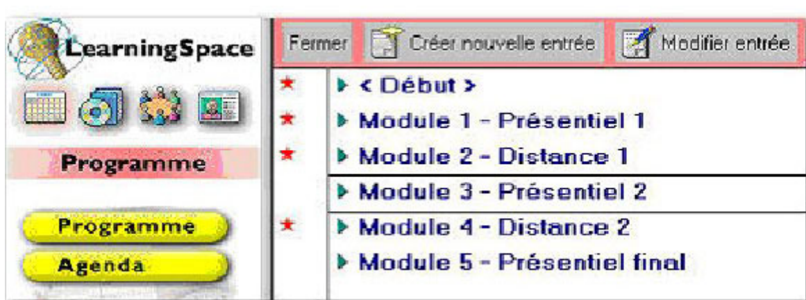
Figure 1 : Interface du programme par matière (agenda des travaux à rendre)

Le suivi du forum permet de voir si tout le groupe participe régulièrement. Les outils offerts nous convenaient puisqu'il était bien question de prendre en charge nos étudiants, de les suivre, de les contrôler et de les aider au moment où la motivation pouvait baisser. Il était donc essentiel de pouvoir suivre le travail de chacun [4] .